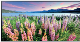
écran Samsung TV LED 32" Full HD Connexion HDMI / Port USB