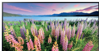
écran Samsung TV LED 32" Full HD Connexion HDMI / Port USB